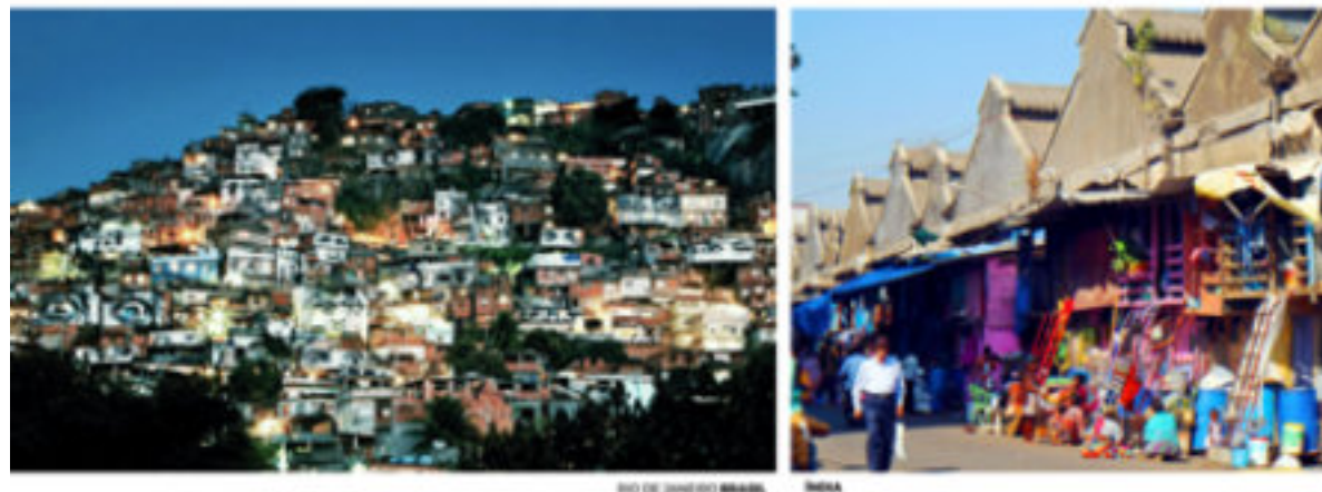
RIO DE JANEIRO BRASIL

Sim, estamos nos referindo aqui às paisagens para a vida . Construídas pelas e para as maiorias, a partir da lógica da sobrevivência, das necessidades e dos desejos de prosperidade, elas se instalam progressivamente – sem plano prévio, mas em relação permanente com as próprias formas propostas pelo planejamento –, em condições escassas de recursos, sobre as localizações disponíveis: periferias distantes, áreas declaradas pelas normas do planejamento urbano como impróprias, terrenos e construções abandonadas.