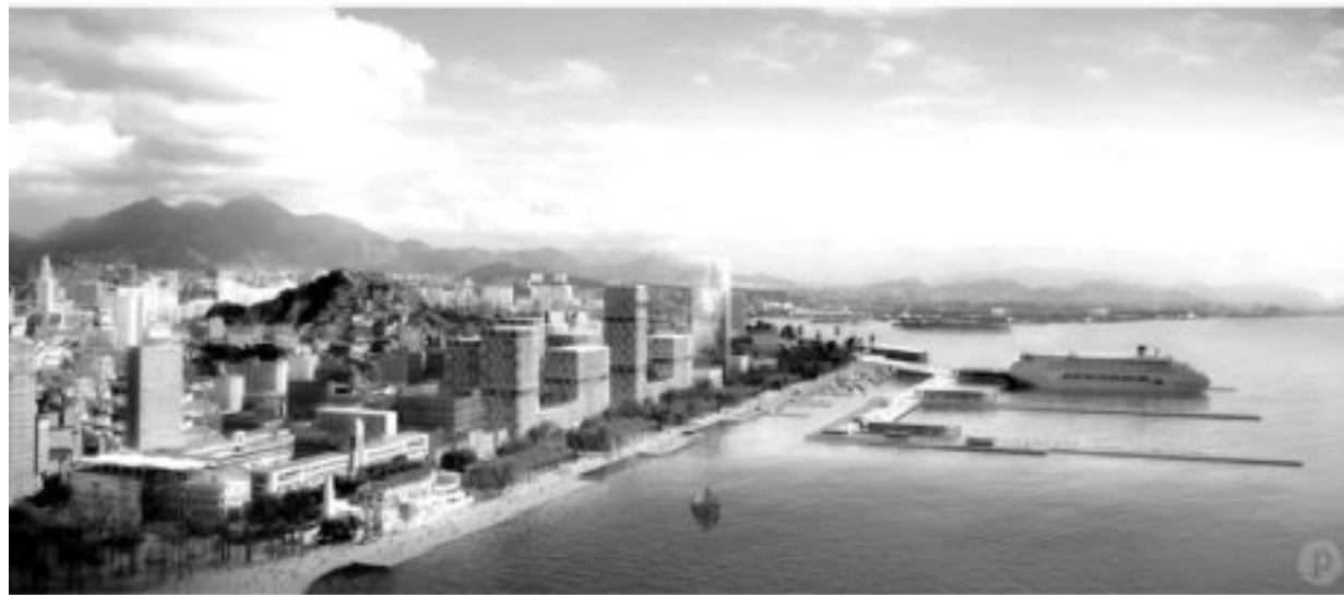
PORTO MARAVILHA RIO DE JANEIRO BRASIL

A horrorosa perimetral do planejamento urbano funcionalista é demolida para constituir esse novo espaço – público? privado? –, não sem antes garantir para a empreiteira a construção de um extenso túnel em sua substituição, já que a matriz rodoviária não é abandonada, é apenas submersa.