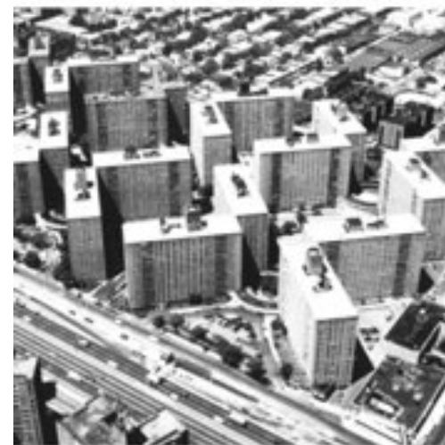
NOVA IORQUE EUA

Na Europa e nos Estados Unidos, utopias racionalizadoras e reformadoras encontraram, na política urbana e no urbanismo, não apenas um campo de aplicação das ideias de integração dos pobres e das chamadas “classes perigosas” para a coesão social sob o capital, mas também um verdadeiro laboratório de reconfiguração territorial