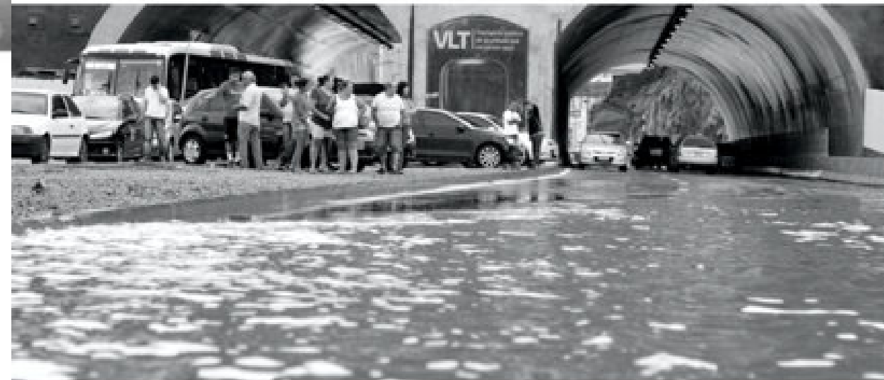
PORTO MARAVILHA RIO DE JANEIRO BRASIL

O projeto do Porto Maravilha, implantado sobre uma área em que 70% dos terrenos eram de propriedade pública, captura um espaço desvalorizado no mercado imobiliário e fundiário para oferecê-lo ao complexo imobiliário-financeiro por meio de novas formas de agenciamento entre Estado e mercado e, também, instaura novos regimes de governo urbano. Nesse projeto, estão presentes elementos-chave do planejamento urbano (pós-moderno?) que correspondem à era da hegemonia das finanças e do ajuste neoliberal das relações Estado-economia-sociedade. Evidentemente, também estão presentes os velhos modos de funcionamento das relações