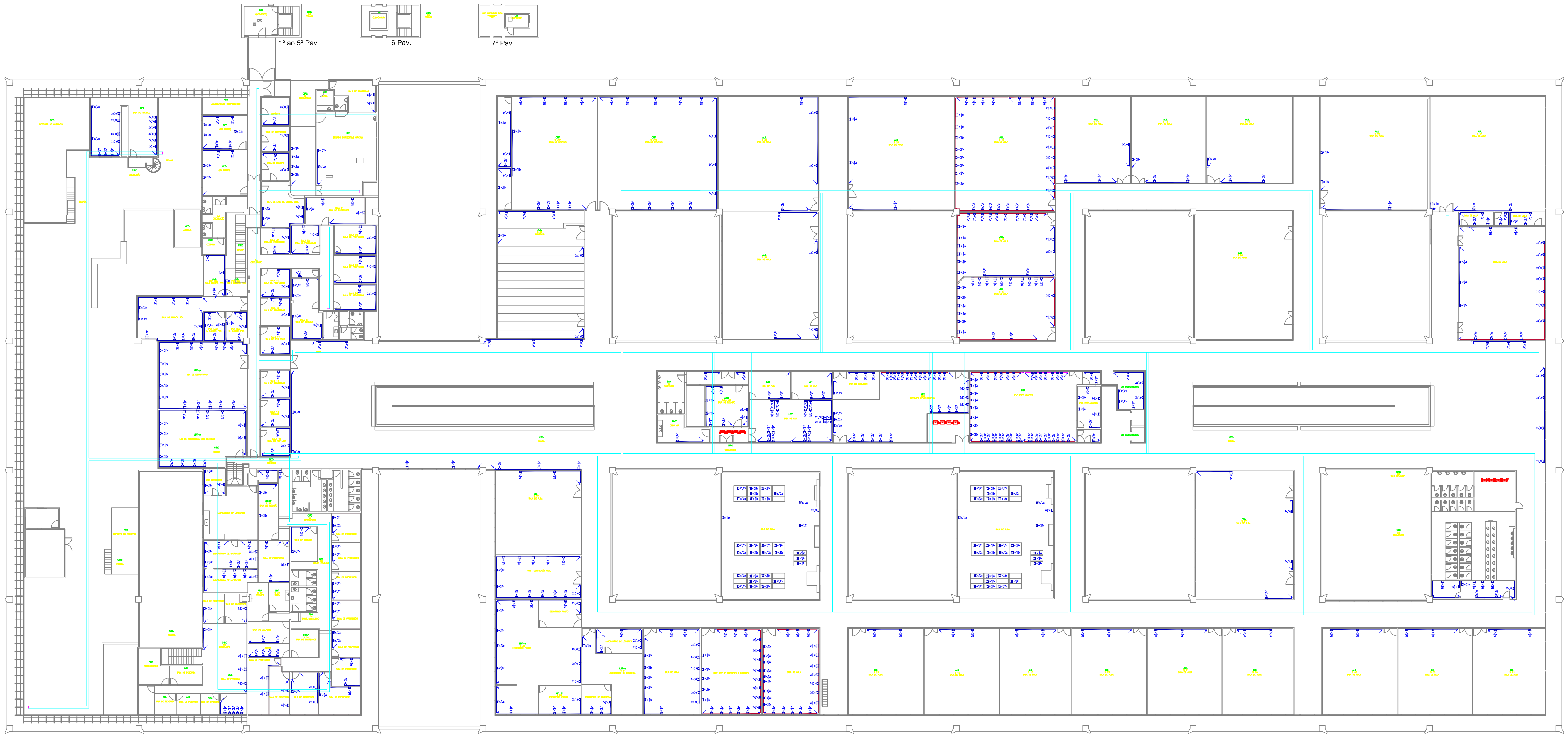
PLANTA - PAVIMENTO SUPERIOR - SPBD16 ESCALA 1:200