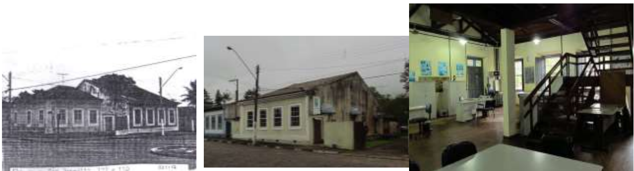
Figura 9: Edifício à praça São Benedito, em Iguape. À esquerda, imagem do PI30916/93, reproduzida por Luiza Gancho; ao centro e à direita, fotos atuais de mesma autoria.

A rigidez observada em relação ao aspecto externo do imóvel não se estende aos seus espaços internos, nos quais se admitia maior liberdade – liberdade que, por vezes, significava o completo desaparecimento das paredes divisórias, como se vê no festejado exemplo do Museu do Mar, em Cananéia, projetado por Lina Bo Bardi; ou no imóvel da Fundação Florestal, em Iguape, dos quais só restaram as paredes externas (Figuras 8 e 9).