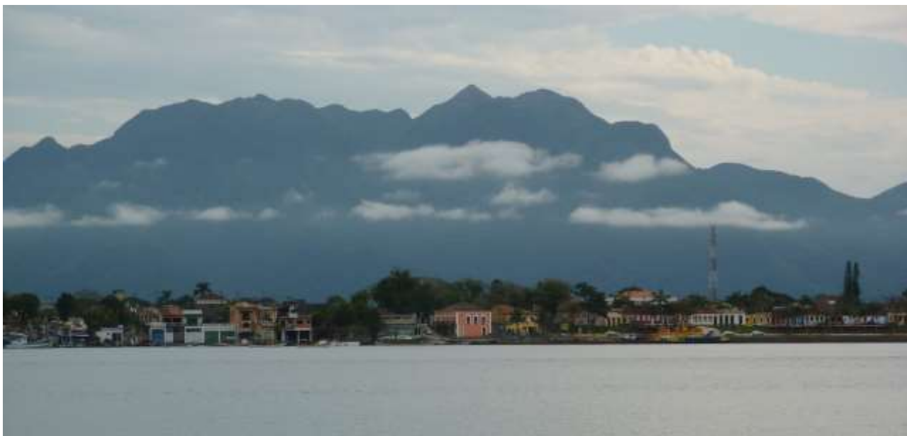
Figura 2: Vista geral de Cananéia.

Iguape é o principal porto da região aurífera da bacia do Rio Ribeira de Iguape, no qual o ouro de lavagem encontrado na região era fundido, quintado e enviado à metrópole. Esta fase da história de Iguape entrou em decadência após a descoberta de ouro nas Minas Gerais, sendo sucedida por uma nova fase de prosperidade com a cultura do arroz nas zonas ribeirinhas ao rio. Em meados do século XIX a cidade contava com dez engenhos de beneficiamento de arroz, o que gerava intenso movimento no porto. Em que pese a opulência do patrimônio então erigido, tal atividade também entrou em decadência nas primeiras décadas do século XX, em boa parte devido às consequências ecológicas da construção de um canal para facilitar o escoamento da produção ribeirinha até o porto, o que acabou por produzir efeito contrário devido ao assoreamento da área portuária. Iguape tem sobrevivido como centro religioso, atraindo milhares de romeiros na festa do Senhor Bom Jesus, e também como centro de turismo ligado ao balneário de Ilha Comprida (Figura 3).