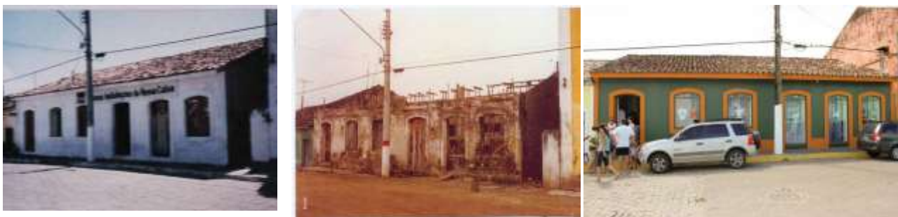
Figura 10: Edifício à Rua Pero Lobo, 135, em Cananéia, antes e depois de intervenção. À esquerda, duas imagens do PC 24594/86 reproduzidas por Susan Ritschel; à direita, foto atual de mesma autoria.

Verifica-se, nesse sentido, certo paralelismo entre a atuação do SPHAN/IPHAN nos primeiros conjuntos urbanos tombados a nível federal, como descrito por Lia Motta (1987) em seu conhecido artigo sobre Ouro Preto. Com a relevante diferença de que, como já ressaltado, a criação do CONDEPHAAT é trinta e um anos posterior à criação do órgão federal, quando o debate sobre o restauro de bens culturais já alcançara avanços significativos a nível internacional - consubstanciados na própria Carta de Veneza -, e mesmo nacional.