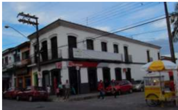
Figura 7: Casa geminada após demolição do vizinho. À esquerda, imagem constante do PI 21112/79; ao lado, o estado atual do imóvel.

Invocando o crescente agravamento dos problemas de trânsito da cidade, “principalmente nas temporadas de verão e durante as festividades do padroeiro da cidade, quando temos a oportunidade de receber a visita de mais de 50.000 romeiros”, o prefeito decidiu desapropriar imóvel tombado geminado para alargamento do Porto General Câmara, um dos principais acessos ao recinto onde se realiza a festa do Bom Jesus dos Navegantes, o maior evento turístico de Iguape e fonte de rendimentos para o município (PI 00577/75, fls.8 e 9). Após a demolição do imóvel, seu vizinho geminado solicitou a abertura de janelas na antiga parede divisória, o que foi negado a partir do seguinte parecer técnico: