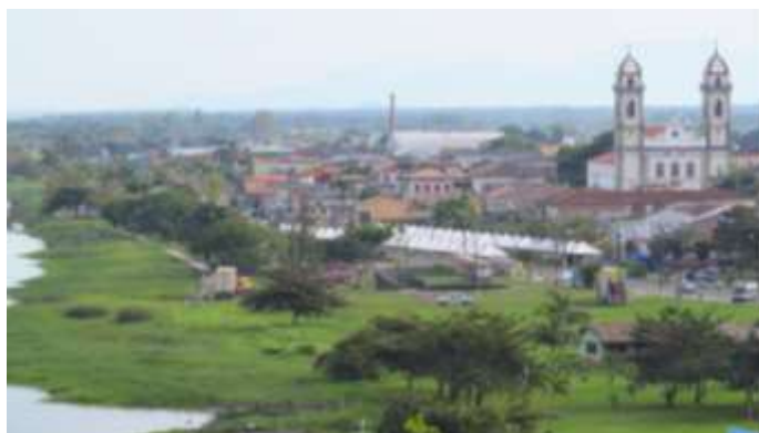
Figura 3: Vista geral de Iguape. À esquerda, antiga área portuária; à direita, a Basílica do Bom Jesus. Foto: Luiza Gancho, 2012.

Assim, já em 07/05/1973, o prefeito da cidade solicitou a revisão do tombamento, alegando que inúmeros imóveis tombados “não desfrutam da aparência de ancianidade”, casos em que não se justificaria “tal impedimento do progresso da cidade”. O pedido foi bem recebido pelo órgão, que, de acordo com o parecer técnico então exarado, já previa a necessidade de reavaliação do perímetro protegido, considerando dignas de tutela apenas a Igreja Matriz e “uma ou outra casa”, liberando assim o CONDEPHAAT “das constantes reclamações de proprietários humildes de casas imprestáveis”. O mesmo parecer alertava também para que se tombasse “o traçado viário da cidade, a sua implantação ao terreno cortado pelo córrego Piranha, cujas margens desimpedidas deveriam ser resguardadas”, bem como “a conservação do gabarito atual das edificações”, já que “o que interessa é a escala, a proporção que conservam entre si as edificações, mormente na praça principal”. Destacava ainda o perfil da cidade, “nitidamente recortado pelos telhados escuros, que necessariamente deve ser conservado” (PC 00278/73, fls. 2 e 4) 4 .