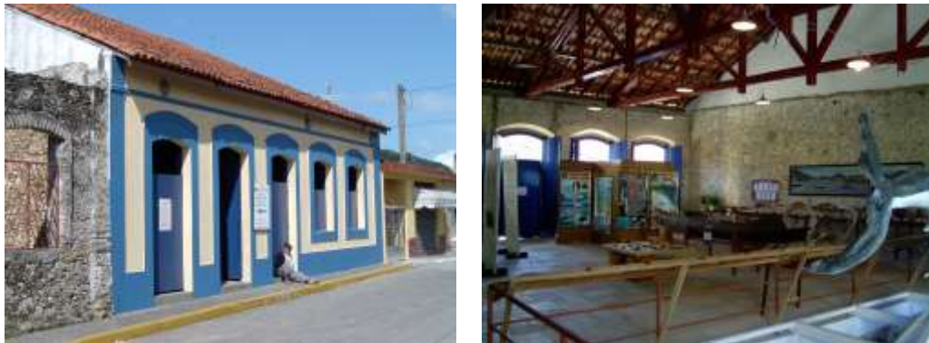
Figura 8: Museu do Mar, projetado por Lina Bo Bardi: fachada e interior.

Não é demais ressaltar que, tomado como imperativo, o pressuposto do “retorno ao estado original” afronta diretamente o princípio da distinguibilidade das intervenções de restauro, previsto nos artigos 11 e 12 da Carta de Veneza.