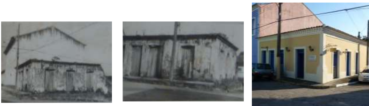
Figura 11: Imóvel à R. Pero Lobo, em Cananéia, antes e depois de intervenção. À esquerda, duas imagens do PC 000314/73 reproduzidas por Viviane Tiezzi; à direita, o imóvel atual em foto da autora, 2012.

Como ocorreu em Ouro Preto, onde as reiteradas diretrizes de “retorno ao estado original” acabaram por configurar o delineamento do chamado “estilo patrimônio”, também em Cananéia e Iguape verifica-se uma tendência generalizada de adoção de um repertório de normas-padrão, que busca mimetizar as construções antigas 7 (Figura 10). Assim, tanto as construções em estado de arruamento como aquelas inteiramente novas recebem um tratamento arquitetônico estilizado, que, na maior parte das vezes, resulta em semi-simulacros da arquitetura colonial (Figuras 7, 10 e 11), postura bem recebida pelo CONDEPHAAT, como no caso da reforma do imóvel à Praça da Basílica, em Iguape, que buscava “assemelhar-se mais à fachada original de 1919” (PI 22981/84, fls. 2), e que recebeu elogioso parecer técnico (PI 22981/84, fls. 2 e 5).