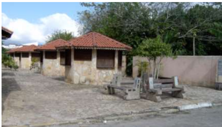
Figura 5: Ocupação atual do Córrego das Piranhas, em Cananéia.

antigas”, acatando também a proposta de proteção das margens do Córrego das Piranhas – proposta que, ao que se pode constatar atualmente (Figura 5), acabou não se concretizando, embora ainda não tenham sido consultados os processos relativos às intervenções recentes feitas no local. O estudo foi aprovado pelo Conselho Deliberativo, que, na oportunidade, confessou que, até aquele momento, “nosso conhecimento de Cananéia era quase sempre superficial” (PC 00278/73, fls. 24-6).