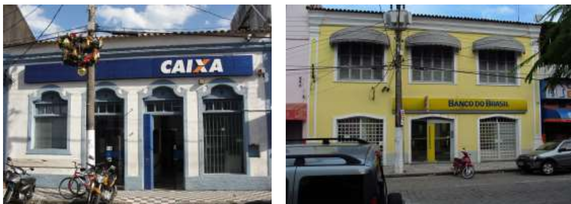
Figura 12: Agências bancárias em Iguape. Fotos de Luiza Gancho, 2012.

É difícil entender a persistência, ainda hoje, de uma postura preservacionista tão anacrônica a ponto de acreditar na reversibilidade do tempo – ou na possibilidade de “vestir os sapatos do autor do projeto”, como queria Viollet-le-Duc.