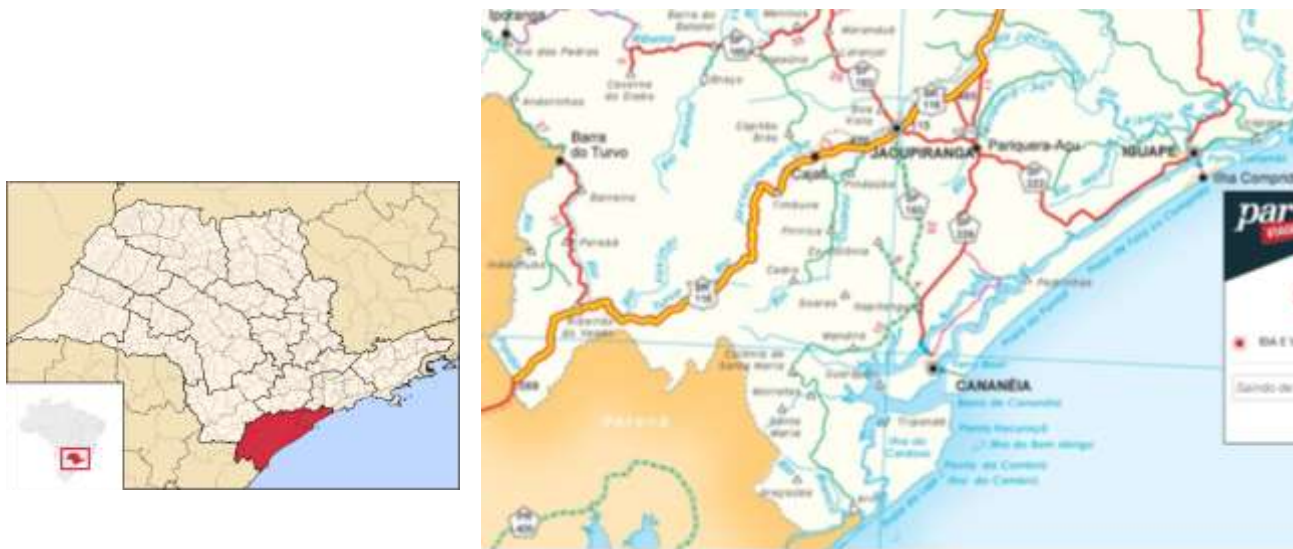
Figura 1: Mapa do litoral sul do Estado de São Paulo

(Proc. 00057/71, Res. 20/06/80) e Iguape (Proc. 00469/74, Res. 06/02/75) 2 , ainda que alguns deles tenham demorado muitos anos para serem instruídos, como se vê nas datas das respectivas Resoluções de Tombamento.