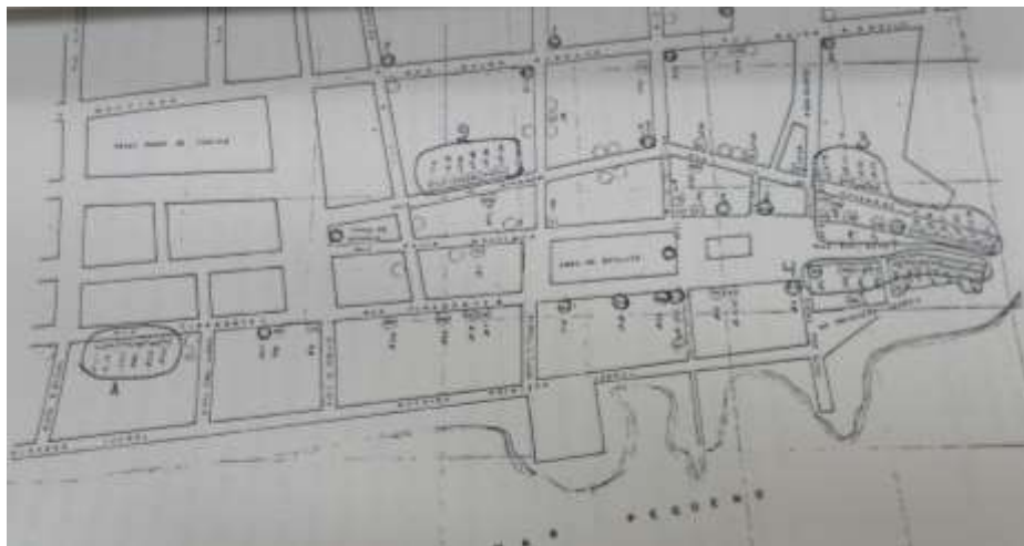
Figura 6: Perímetro de tombamento de Iguape: identificação das manchas de edificações de interesse. Imagem do PI 17203/70, reproduzida por Luiza Gancho.

plantas e todos os nossos pedidos de maior vigilância foram esquecidos (PI 00469/74, fls. 6-7).