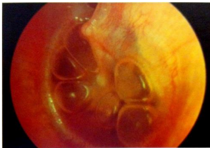
Fig.3 Otoscopia de paciente com otite média aguda