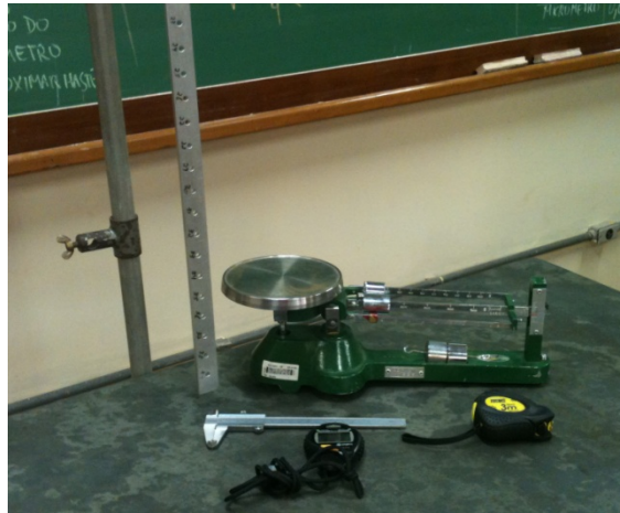
Figura 2. Materiais a serem utilizados no experimento.

Haste de suspensão, uma barra de metal com vários furos que será utilizada como pêndulo físico, cronômetro, trena e balança.