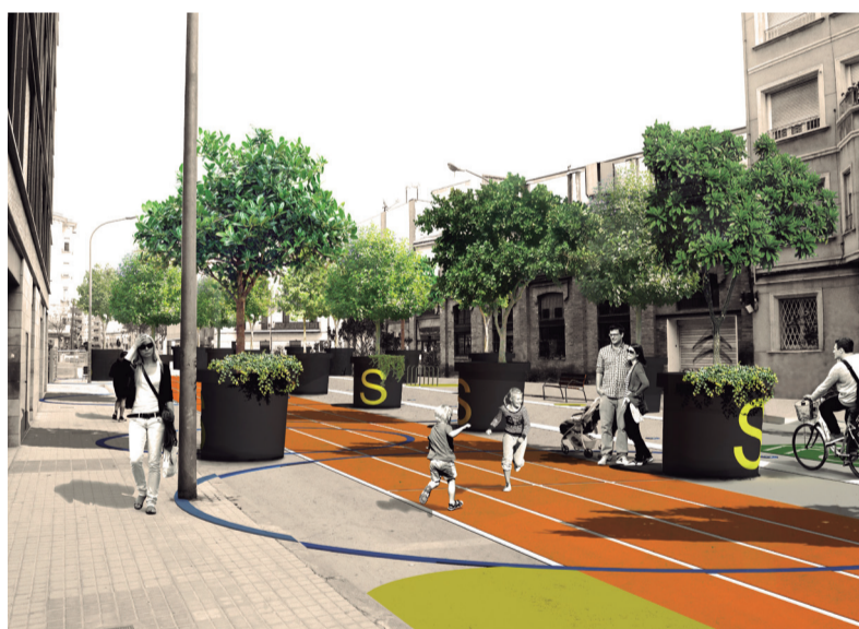
Imatge virtual orientativa del tram del carrer dels Almogàvers entre els carrers de Ciutat de Granada i Roc Boronat.

— Àmbits d'actuació de les obres de reurbanització