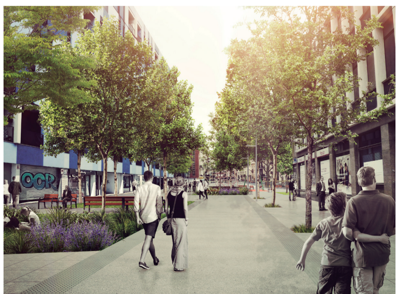
Imatges virtuals orientatives de models d'urbanització definitiva.