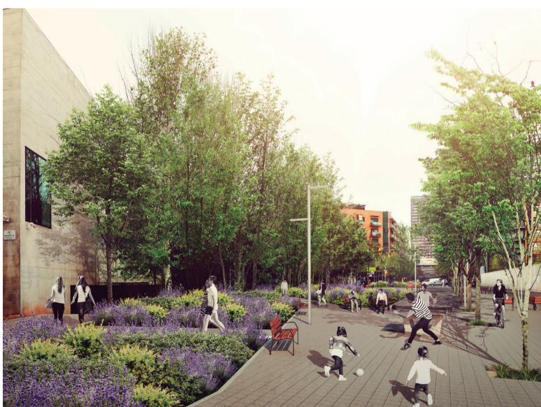
Imatges virtuals orientatives de models d'urbanització definitiva.