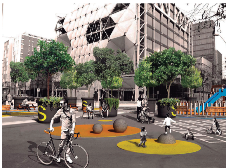
Imatge virtual orientativa de la cruïlla dels carrers de Sancho de Àvila i Roc Boronat.