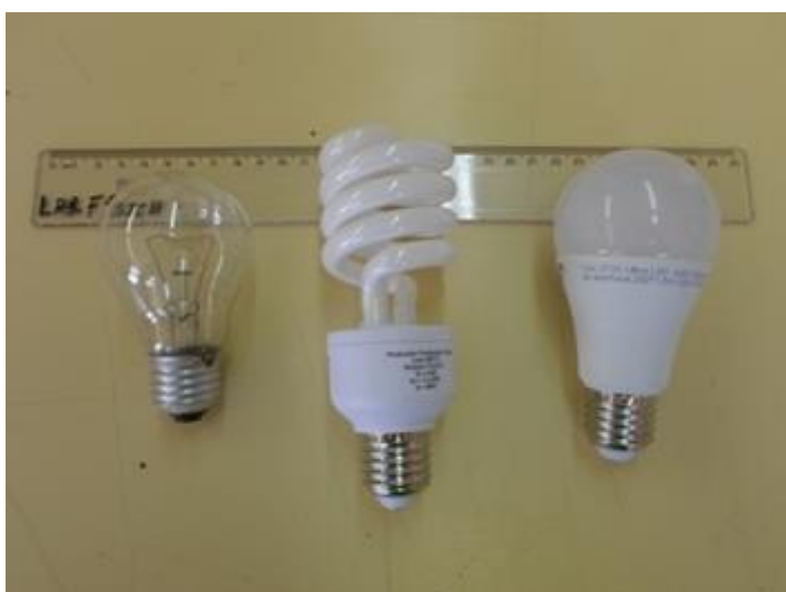
Figura 1. Lâmpadas Incandescente, Fluorescente Compacta e LED.

A segunda etapa contou com a utilização do método experimental onde coleta de dados e ensaios foram feitas no Laboratório de Física da Universidade Regional do Noroeste do Estado do Rio Grande do Sul (UNIJUI). No experimento foram utilizados os três tipos de lâmpadas em estudo (Figura 1), acoplados em um suporte simples tipo rosca, acomodado em uma caixa de isopor (EPS) com espessura de parede de dois centímetros (2 cm) e volume interno de 10 litros (Figura 2). Vinculado à caixa, foram acoplados três termômetros de mercúrio para leitura de dados de temperatura em diferentes pontos da caixa.