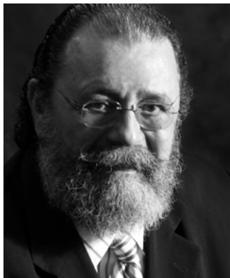
EROS ROBERTO GRAU Professor USP e Ex-Ministro STF

“Um dos setores do Direito no âmbito do qual o fenômeno da inflação normativa se manifesta de maneira exacerbada é o voltado à ordenação das relações tributárias. Precisamente em razão disso o nosso direito positivo contempla o instituto da consulta em matéria tributária, via do qual se permite ao contribuinte buscar a certeza do Direito aplicável a determinada situação que relata à Administração”.