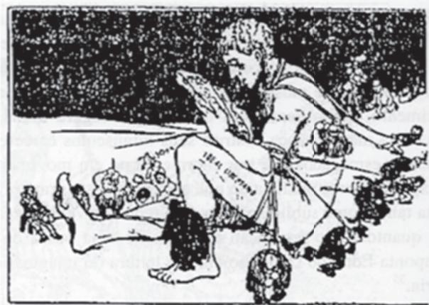
FIGURA 8 – A Lanterna . São Paulo, n. 227, 24 jan. 1914, p. 1.