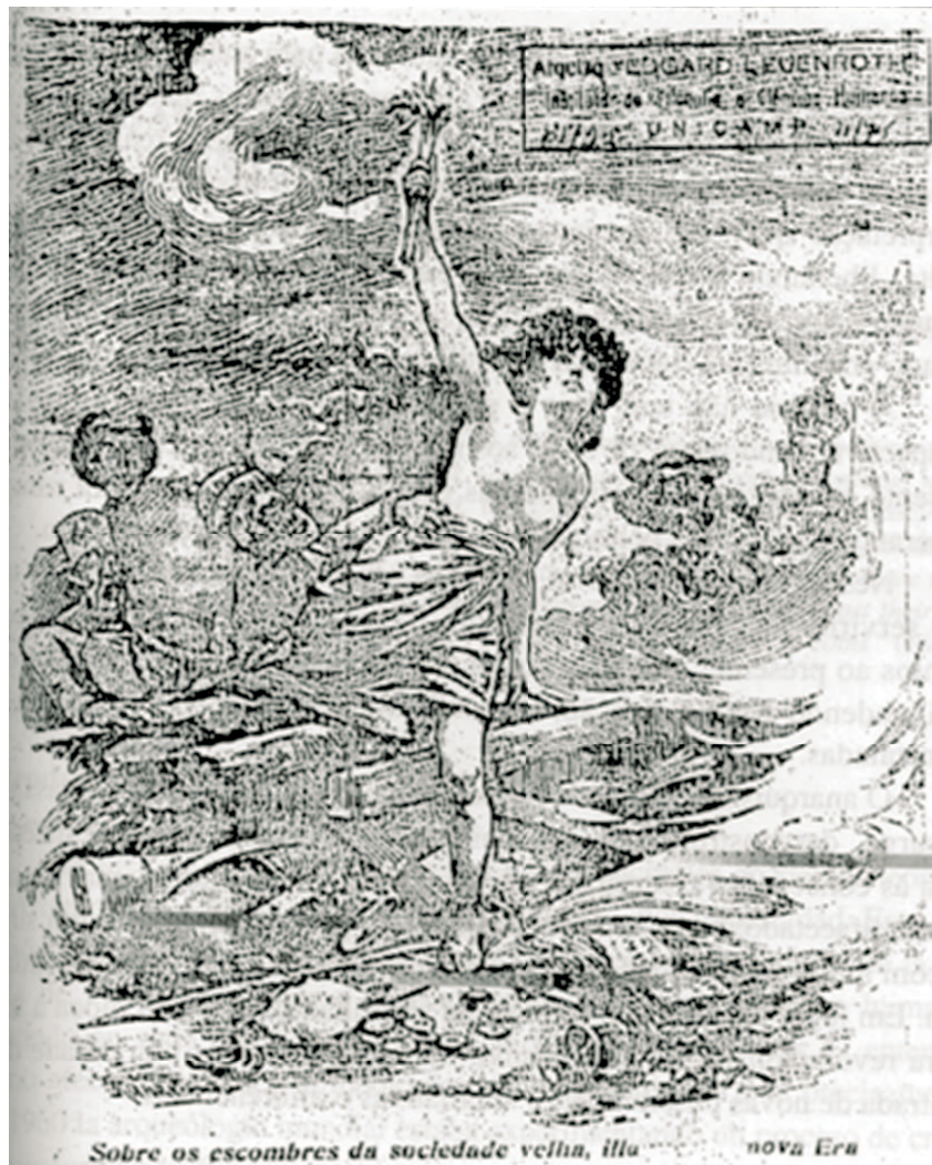
FIGURA 9 – A Plebe . São Paulo, n. 8, 12 abr. 1919, p. 1.