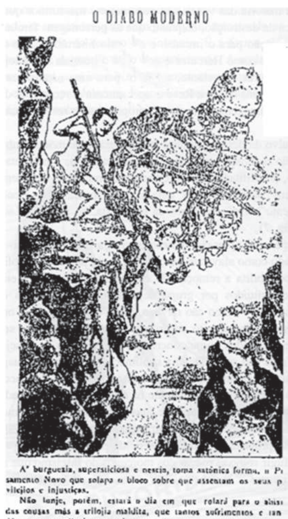
FIGURA 7 – A Luta . Porto Alegre, n. 41, 16 jan. 1909, p. 1.