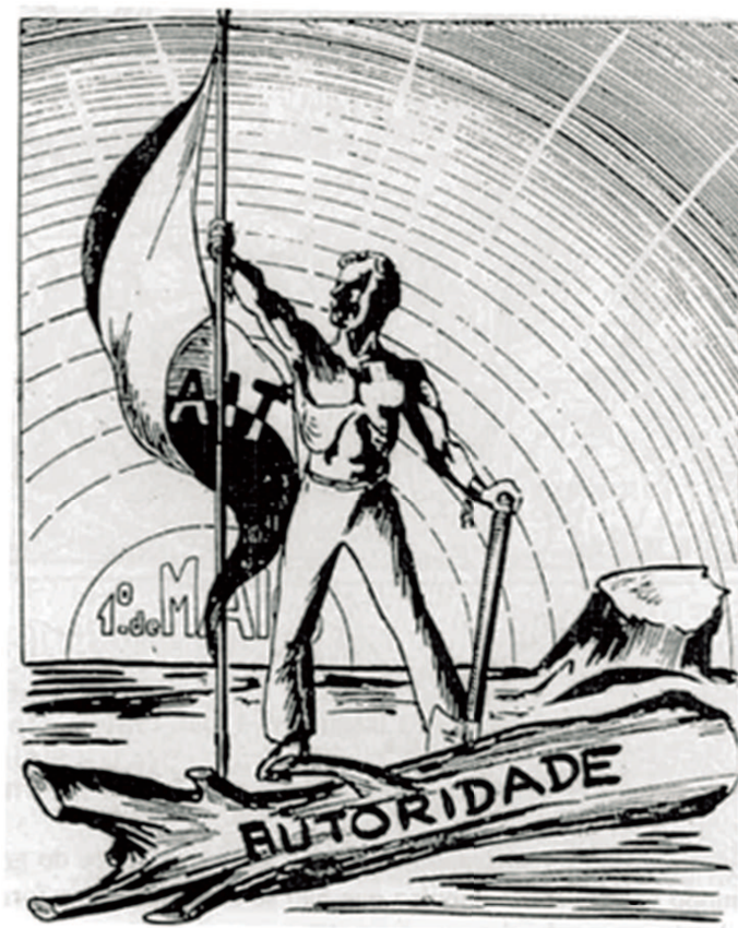
Figura 6 A Plebe . São Paulo, n.º 87, 27 abr. 1935, v. 1.