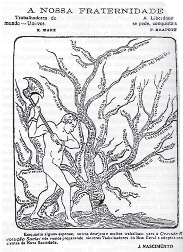
FIGURA 1 – Nova Sociedade . Rio de Janeiro, n. 1, jan. 1923, p. 1.