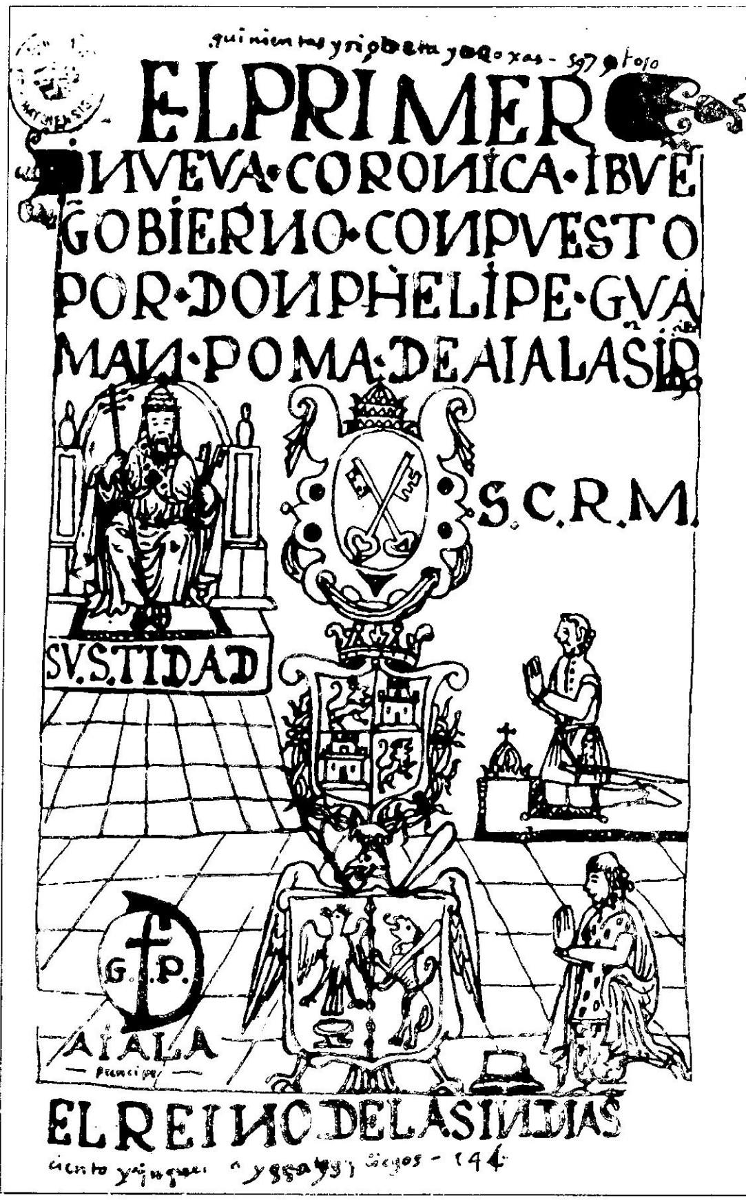
Guaman Poma de Ayala, El reino de las Indias . Frontispicio. El primer nveva coronica i bven gobierno .