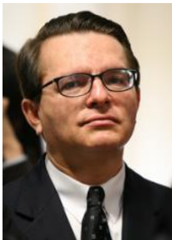
MIN. HERMAN BENJAMIN

“Vassoura, espanador ou o pano de chão entram?”, questionou.