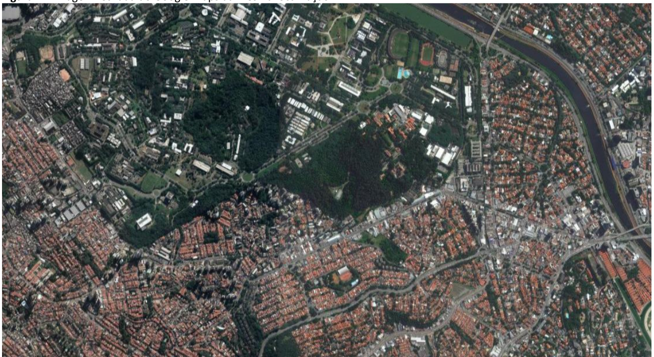
Figura 2 – Imagem retirada do Google Maps da mesma localização.