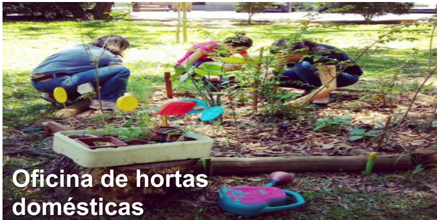
Oficina de hortas domésticas