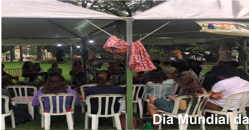
Dia Mundial da Alimentação