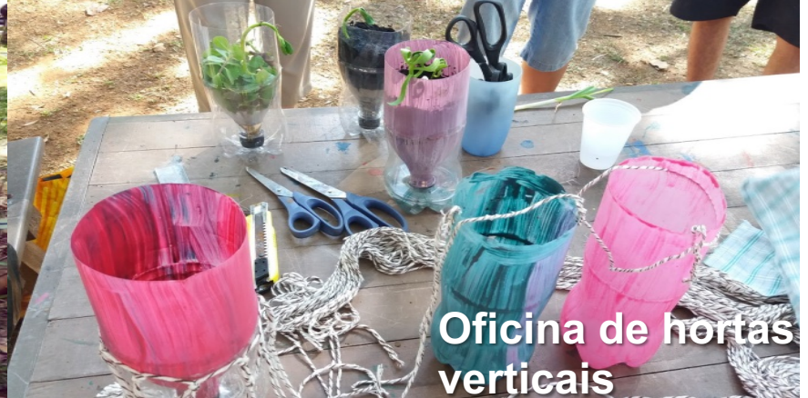
Oficina de hortas verticais