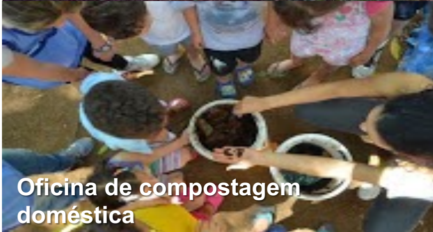
Oficina de compostagem doméstica