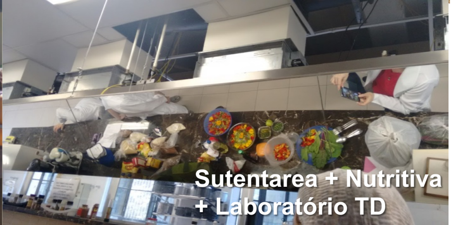
Sustentarea + Nutritiva + Laboratório TD