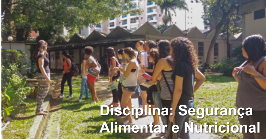
Disciplina: Segurança Alimentar e Nutricional