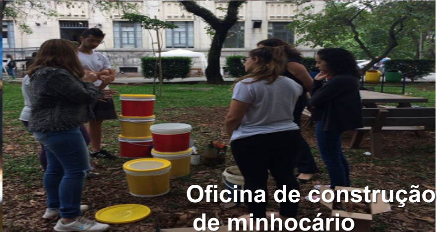
Oficina de construção de minhocário