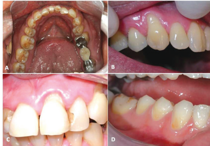
Figura 1. Aspectos clínicos das lesões não cariosas: A – atrição, B – abrasão, C – abfração, D – erosão

facilita a perda devido aos fenômenos mecânicos. Este fato ilustra o caráter associativo destas lesões. Nem sempre é fácil diferenciá-las, entretanto algumas características clínicas, compiladas no quadro 1, podem auxiliar o diagnóstico. 1 A figura 1 ilustra as lesões não cariosas.