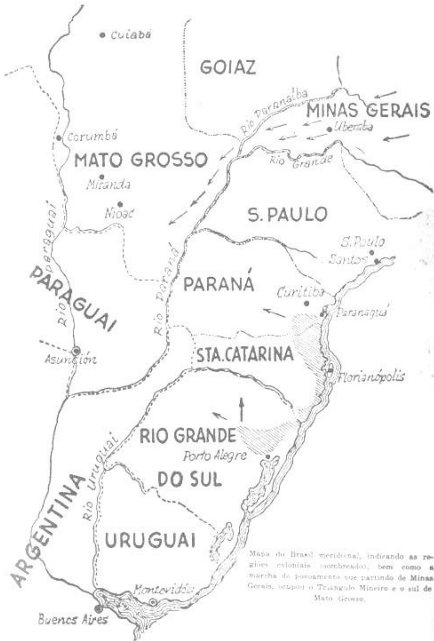
Mapa do Brasil meridional, indicando as regiões coloniais (sombreado), bem como a marcha da povoamento que partindo de Minas Gerais, ocupou o Triângulo Mineiro e o sul de Mato Grosso.