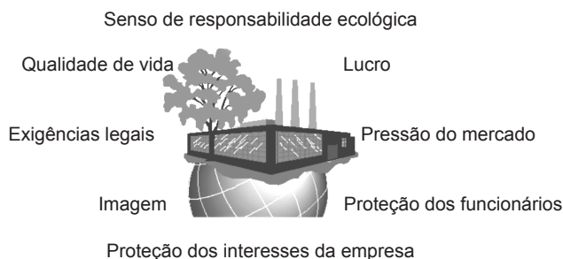
Figura 2. Fatores motivadores para a gestão ambiental empresarial no estágio de integração externa.

Seiffert (2005) indica alguns tipos de benefícios que motivam as empresas manufatureiras a possuírem uma ecoestratégia: a) benefícios econômicos, tais como redução de consumo de insumos, redução de multas e penalidades por poluição excessiva, aumento da demanda para produtos que contribuam para a diminuição da poluição,