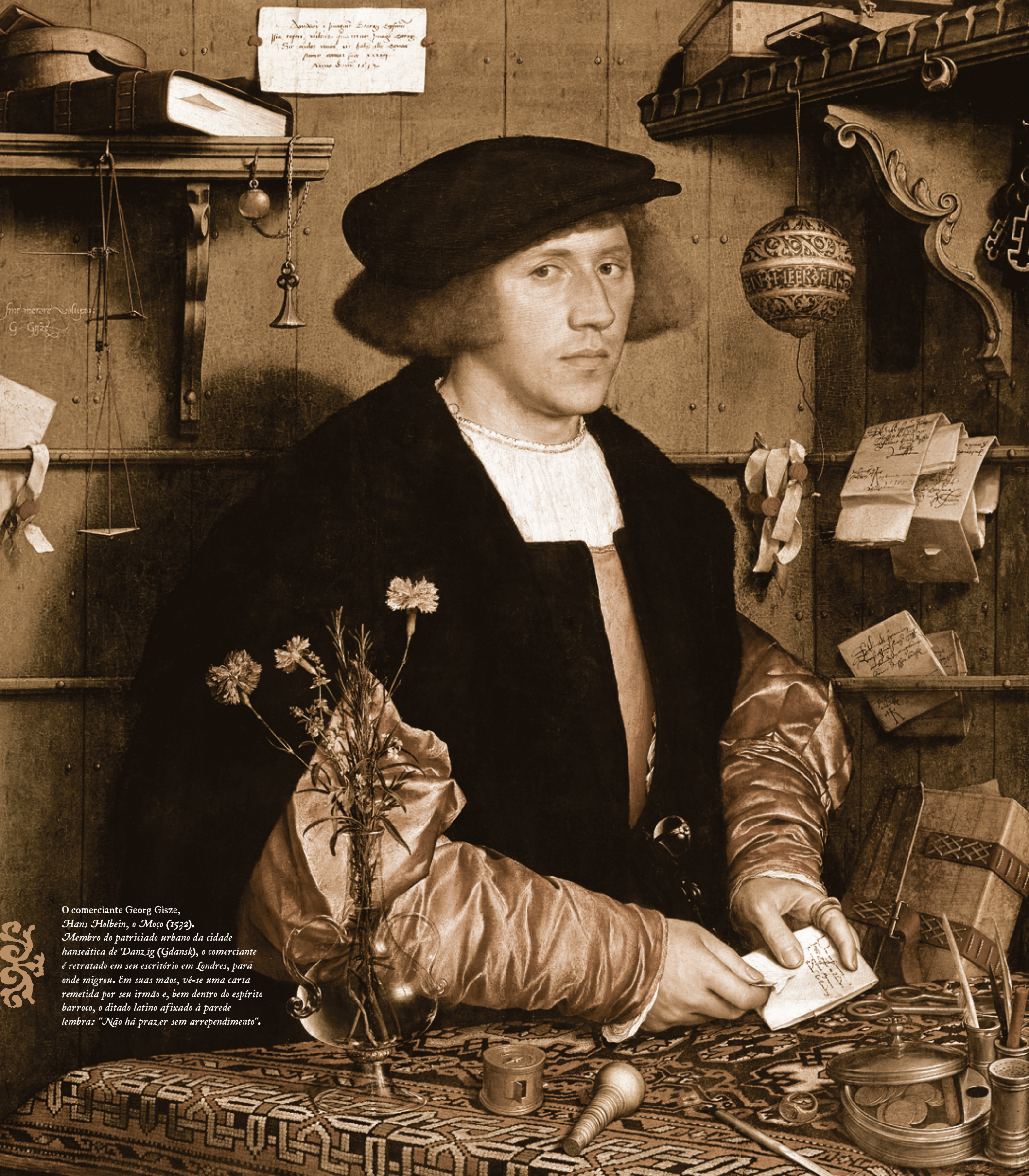
O comerciante Georg Gisze, Hans Holbein, o Moço (1532). Membro do patriciado urbano da cidade hanseática de Danzig (Gdansk), o comerciante é retratado em seu escritório em Londres, para onde migrou. Em suas mãos, vê-se uma carta remetida por seu irmão e, bem dentro do espírito barroco, o ditado latino afixado à parede lembra: "Não há prazer sem arrependimento".