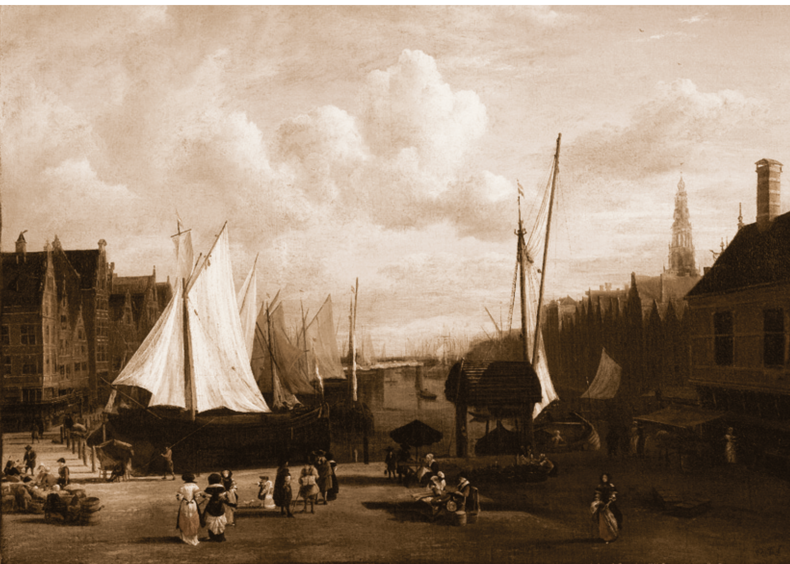
Cais de Amsterdã, Jacob van Ruisdael (ca. 1670).