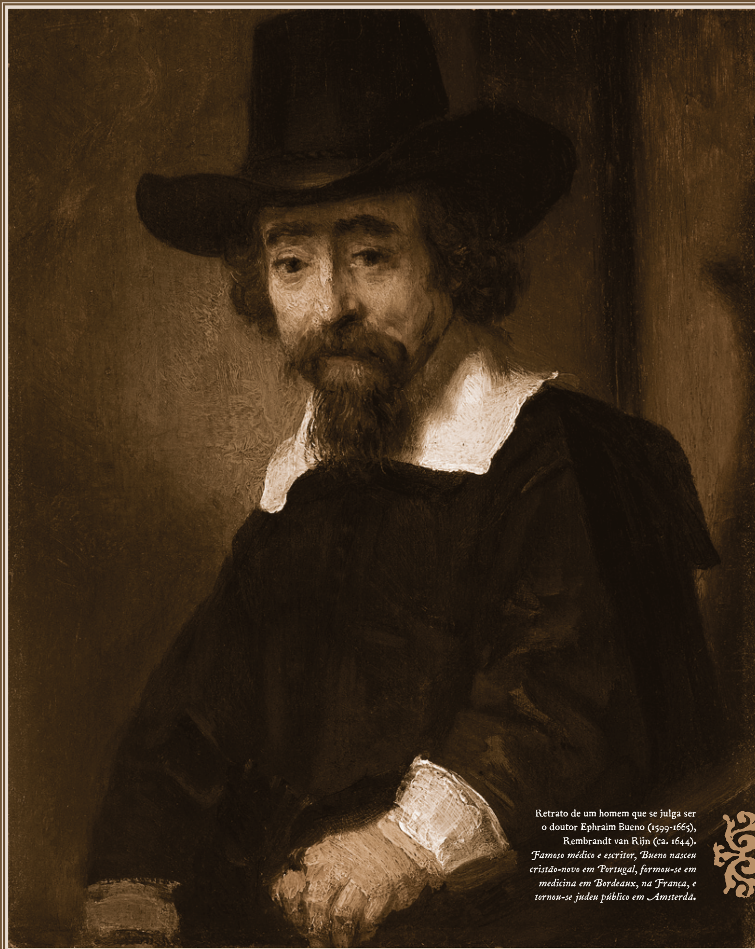
Retrato de um homem que se julga ser o doutor Ephraim Bueno (1599-1665), Rembrandt van Rijn (ca. 1644). Famoso médico e escritor, Bueno nasceu cristão-novo em Portugal, formou-se em medicina em Bordeaux, na França, e tornou-se judeu público em Amsterdã.