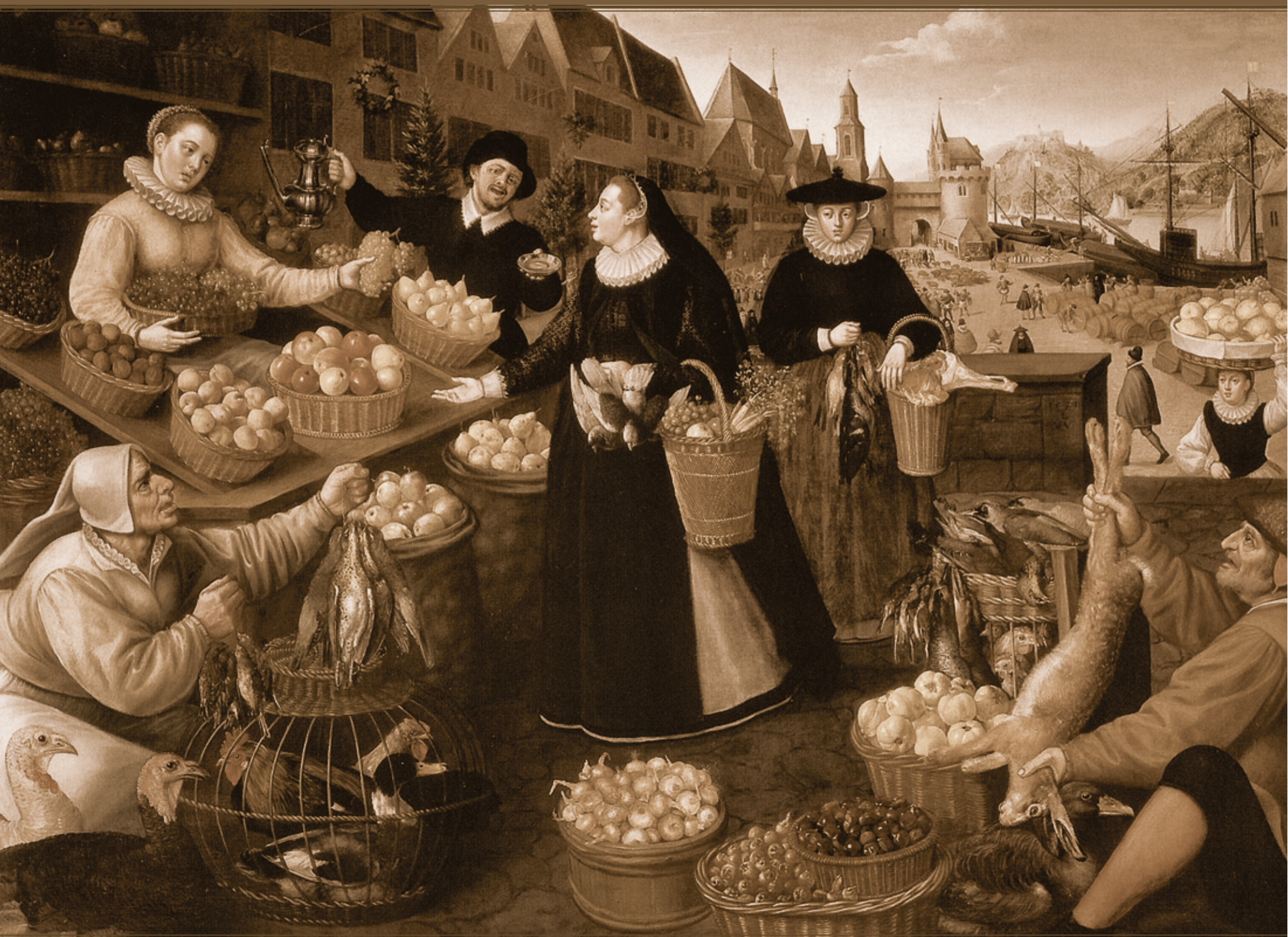
Alegoria do outono: vendedora atendendo clientes distintos no Weinmarkt de Frankfurt, atribuído a Lucas van Valckenborch e Georg Flegel (1594).