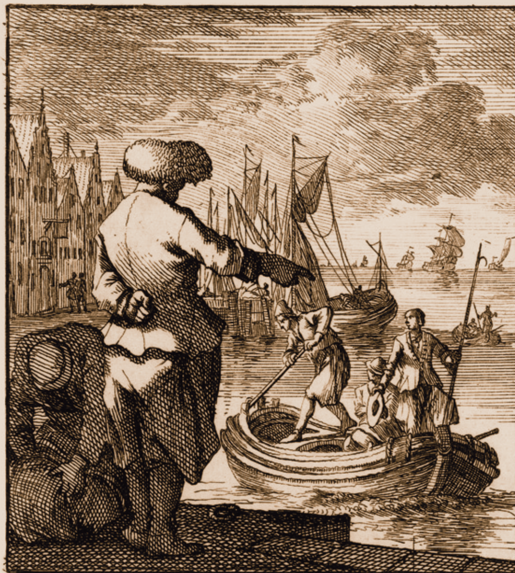
Na gravura do Livro dos ofícios (1694), vê-se o carregamento de uma embarcação supervisionado por um mercador ou mestre de navios.