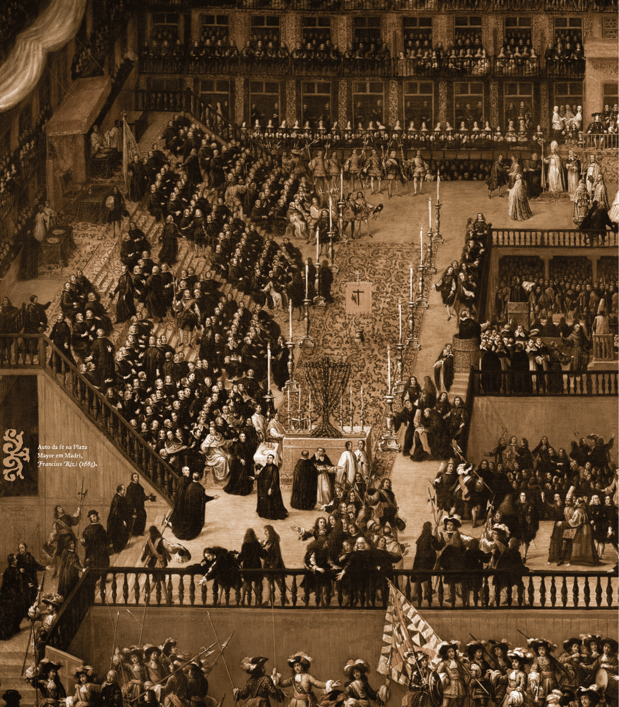
Auto da fé na Plaza Mayor em Madri, Francisco Rizzi (1682).