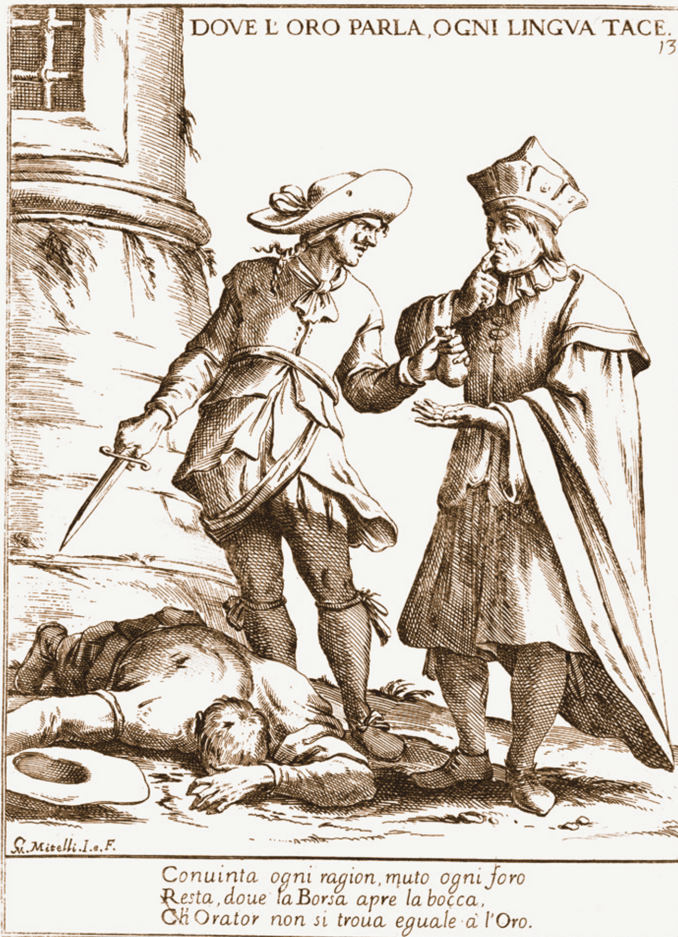
Onde o ouro fala, todas as linguas se calam, Giuseppe Maria Mitelli (1678). Ao empregar um agente, o mercador expunha-se ao oportunismo.