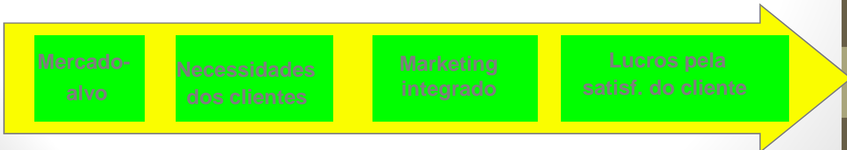
(b) Orientação de marketing