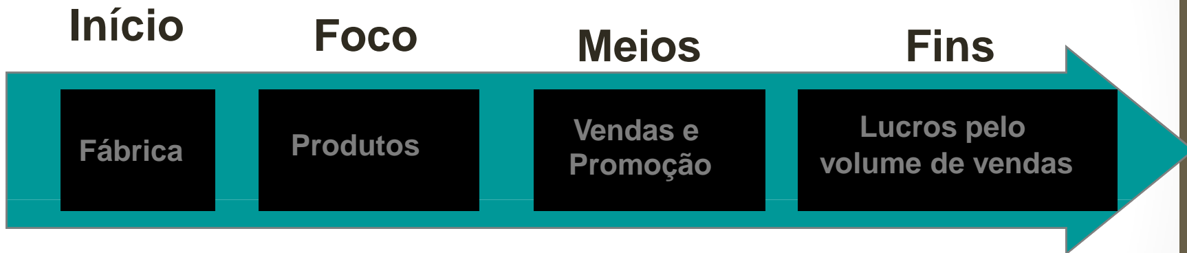
(a) Orientação de vendas