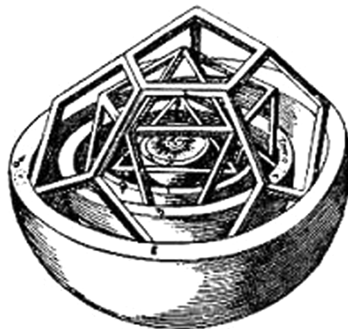
Figura 1 - Modelo cosmológico dos sólidos geométricos de Kepler.

Esse modelo cosmológico foi apresentado em seu livro O Mistério Cosmográfico , de 1596, enviado a Mästlin, que o acolheu muito favoravelmente.