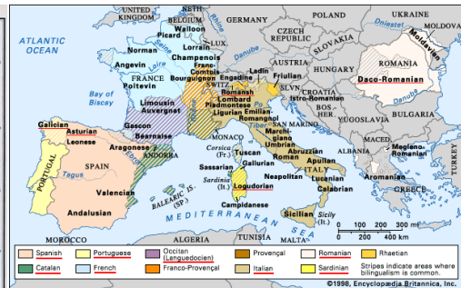
Panorama das Línguas Românicas, séc 21