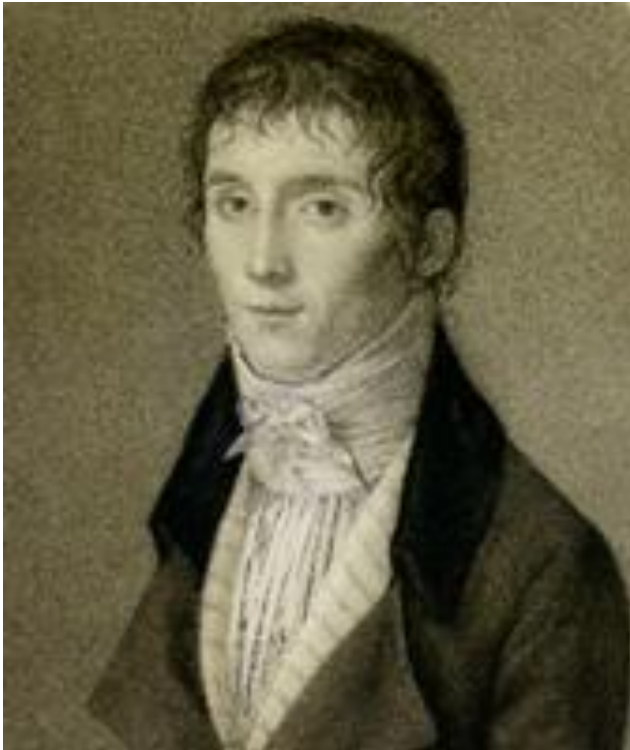
Joseph Nicéphore Niépce