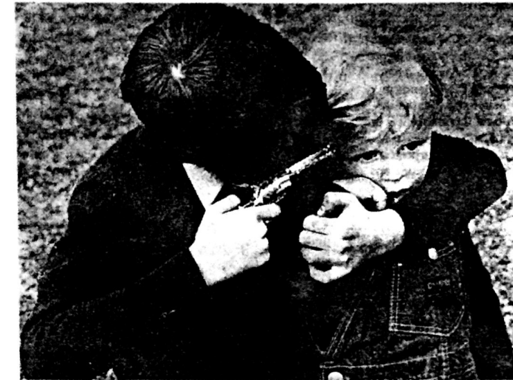
Figura 10.1 Estas crianças estão claramente mostrando um comportamento agressivo e uma postura aprendidos através da observação, provavelmente da televisão. O fato de a "vítima" não ser realmente morta não significa que as crianças não tenham aprendido o conjunto global de respostas.

esses comportamentos. Sua exposição continuada a todos esses modelos fará com que se torne muito difícil para seus pais reforçar comportamentos mais construtivos. Os adolescentes ficam frequentemente furiosos quando seus pais se preocupam com a "turma" com que eles andam. Mas do ponto de vista de Bandura, essa preocupação dos pais é justificada, pois a criança está aprendendo pela observação.