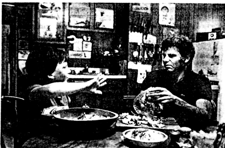
Figura 10.5 Cerca de 10% das crianças cujos pais são divorciados vivem com o pai. A maioria são crianças maiores, e não bebês ou pré-escolares, mas o número está aumentando em todas as idades. Quais serão os efeitos dessa situação? Terá um impacto maior sobre as meninas? Nós ainda não sabemos responder a essas perguntas porque quase não há pesquisas sobre as crianças criadas pelo pai.

criança tinha, presumivelmente, atingido uma resolução preliminar da crise edipiana e depois havia um tipo de calma após a tempestade. A criança também começa a escolarização durante este período, e as novas atividades absorvem suas energias quase que totalmente.