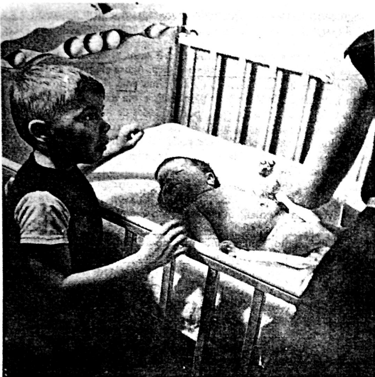
Figura 10.6 Este menino de 6 anos mostra uma nítida culpa – uma qualidade que Erikson considera ser a tarefa central nessa idade. O menino foi deixado sozinho com seu irmão e brincou um tanto violentamente com ele. Quando a mãe voltou, ele retirou as mãos rapidamente e virou-se para a mãe com essa expressão.

Generatividade versus Estagnação: 26-40 Anos Erikson considera que nesta idade, a maturidade e intimidade sexual com um parceiro não é suficiente. Cada adulto também sente uma necessidade de “gerar” em algum sentido – ter e criar crianças, criar algo útil num trabalho, treinar os outros, produzir trabalhos artísticos, ou qualquer outra coisa. Qualquer adulto que não seja bem-sucedido em algum dos aspectos da generatividade pode viver um sentimento de estagnação. E é exatamente o sentimento de estagnação – “o que eu fiz com minha vida?” – que está no núcleo da crise da meia-idade nos 40 anos.