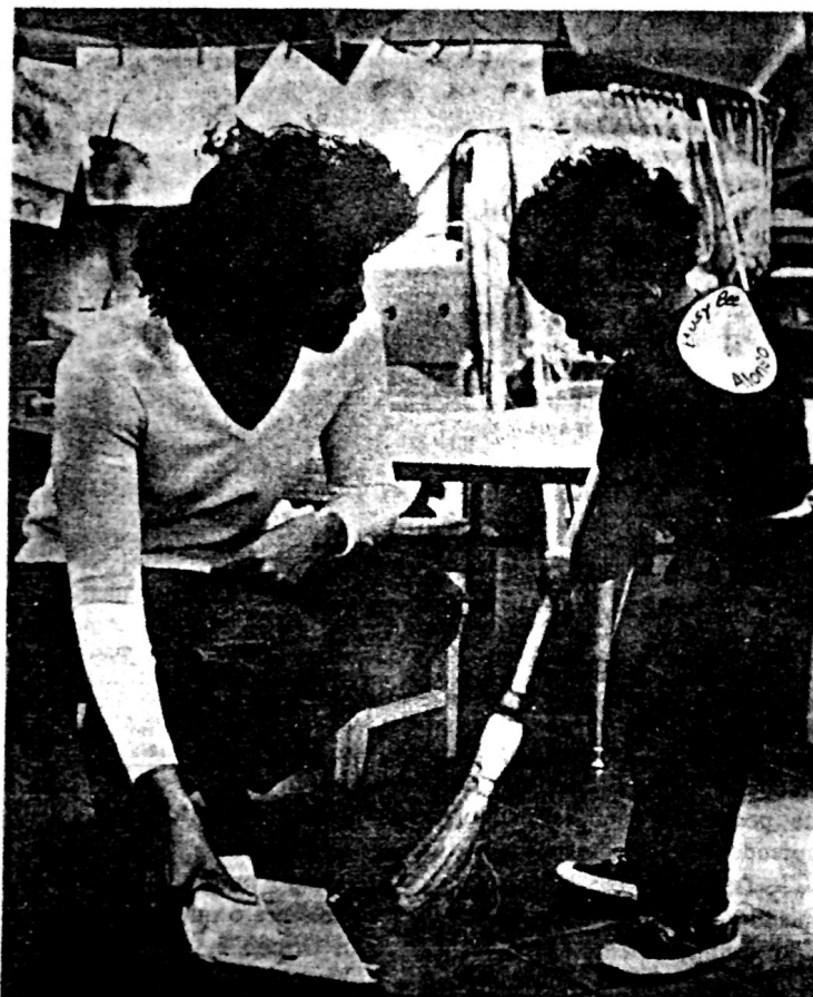
Figura 10.2 Esta criança, que ajuda simpaticamente sua professora na escola maternal, pode ser razão para o desespero de sua mãe em casa. Bandura espera exatamente esse tipo de inconsistência em toda casa em que os padrões de reforçamento são muito diferentes nos dois locais.