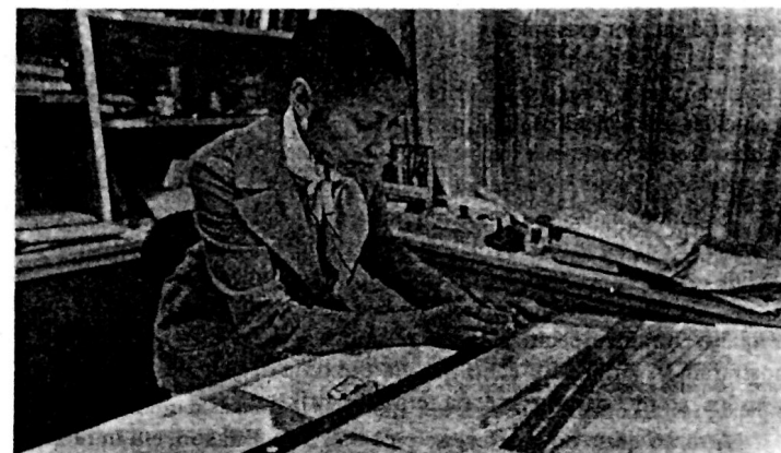
Figura 10.7 Um dos principais atrativos da teoria de Erikson é ser uma teorização sobre todo o ciclo vital. Estes adultos mostram três facetas da generatividade, que Erikson considerou como a principal tarefa do adulto. O foco principal da generatividade é na educação da próxima geração, mas a dedicação ao trabalho e à criatividade também são caminhos pelos quais a generatividade se expressa.

Erikson fez suas proposições básicas a respeito dos estágios de desenvolvimento há mais de 20 anos, mas eu considero que tenha tido um impacto retardado. Seus estágios nos propiciam um bom