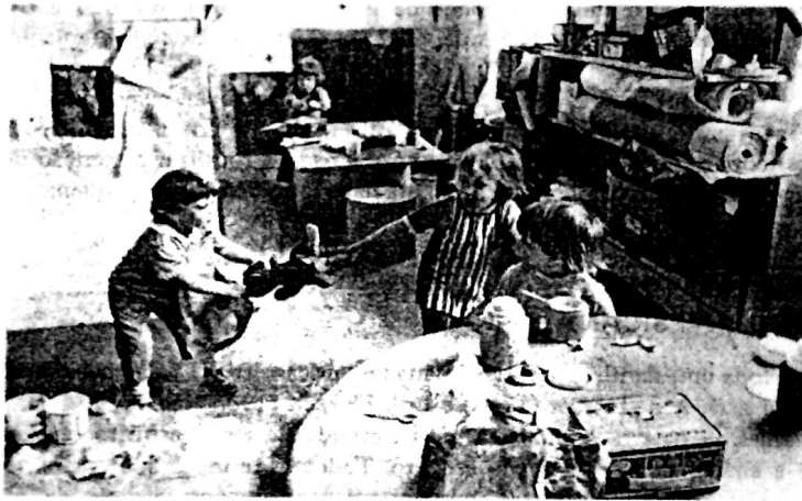
Figura 10.4 Uma criança desta idade tenta conseguir o que quer de forma bastante direta – como a criança que toma da outra o brinquedo. Mas, dois ou três anos mais tarde, a mesma criança pode tentar conseguir o brinquedo indiretamente, pedindo para dividir, pedindo para o professor falar com a outra criança ou brincando juntos. Isso ilustra o desenvolvimento do ego, que opera segundo o que Freud denominou “princípio da realidade”, em oposição ao id que funciona pelo “princípio do prazer”.

O instinto básico que busca a gratificação permanece como uma parte da personalidade; mas, como a gratificação freqüentemente pode ser conseguida com mais sucesso através do planejamento, fala, espera e outras técnicas do que através da urgência do instante, a criança gradativamente transfere energia do id para o ego. Nos termos de Freud, o ego é a parte da personalidade que planeja, organiza e pensa. A criança ainda continua tentando conseguir o que quer, mas agora ela busca a gratificação de seus desejos, usando estratégias baseadas na realidade.