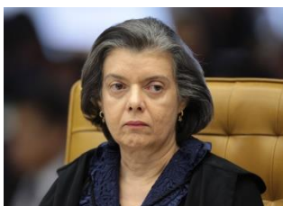
CÁRMEN LÚCIA Ministra STF