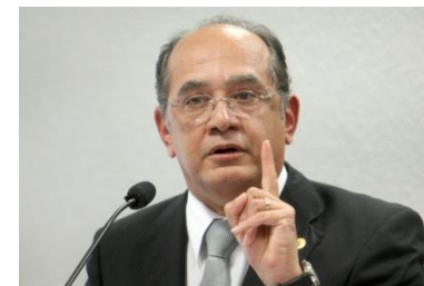
GILMAR MENDES Ministro STF