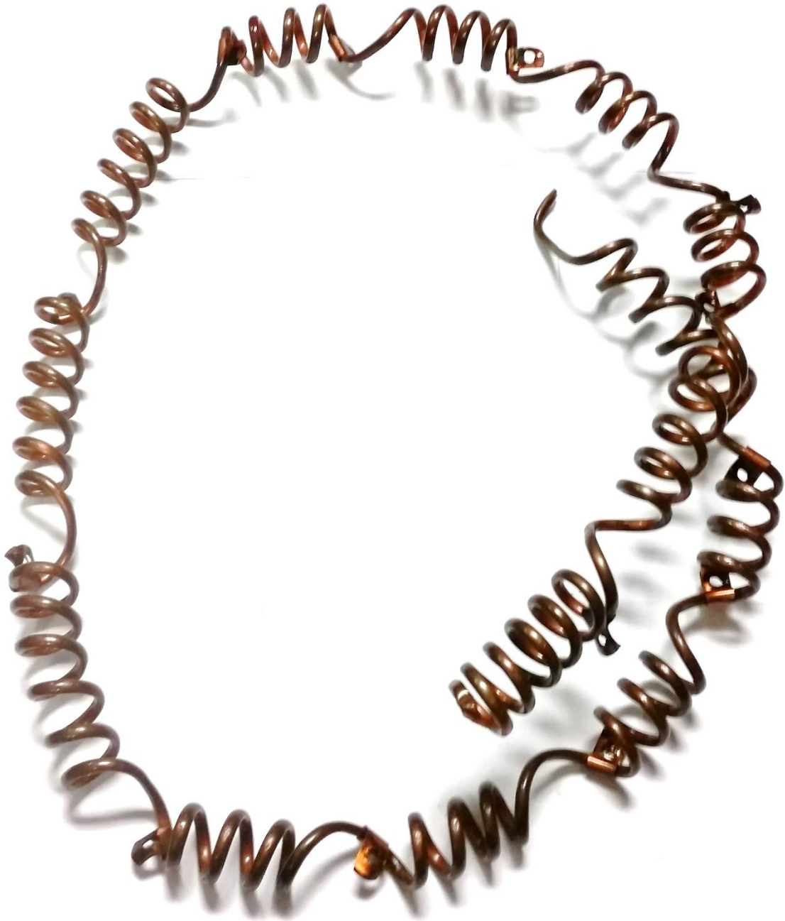
Figura 1 – Serpentina de refrigeração de óleo que sofreu perfuração.

Uma serpentina de refrigeração de óleo, fabricada em tubo de cobre sofreu perfuração. As Figuras 1 e 2 mostram o aspecto da serpentina trazida para análise.