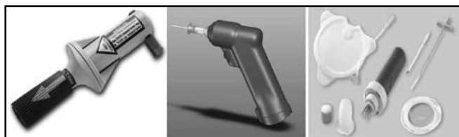
Figura 2 - Equipamentos para Punção Intra-Óssea em Adultos B.I.G.® EZ10® FAST 1®

Um coxim debaixo do joelho com leve rotação externa coxo-femoral facilita a estabilidade da extremidade. (ilustração cedida gentilmente por Dr. Fábio Hüsemann Menezes, modificada de Menezes FH - Acesso à Circulação Venosa, em: Lane JC, Albarán-Sotelo R - Reanimação Cardiorrespiratória Cerebral. Rio de Janeiro: Editora Medsi, 1993;177).