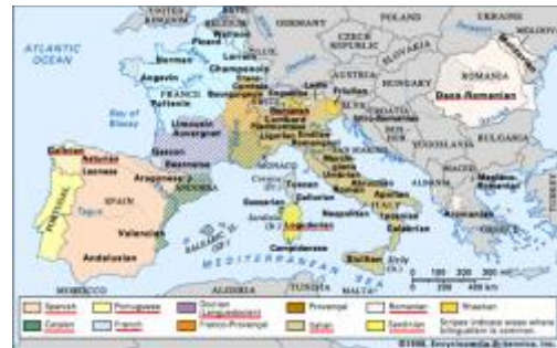
Panorama das Línguas Românicas, séc 21