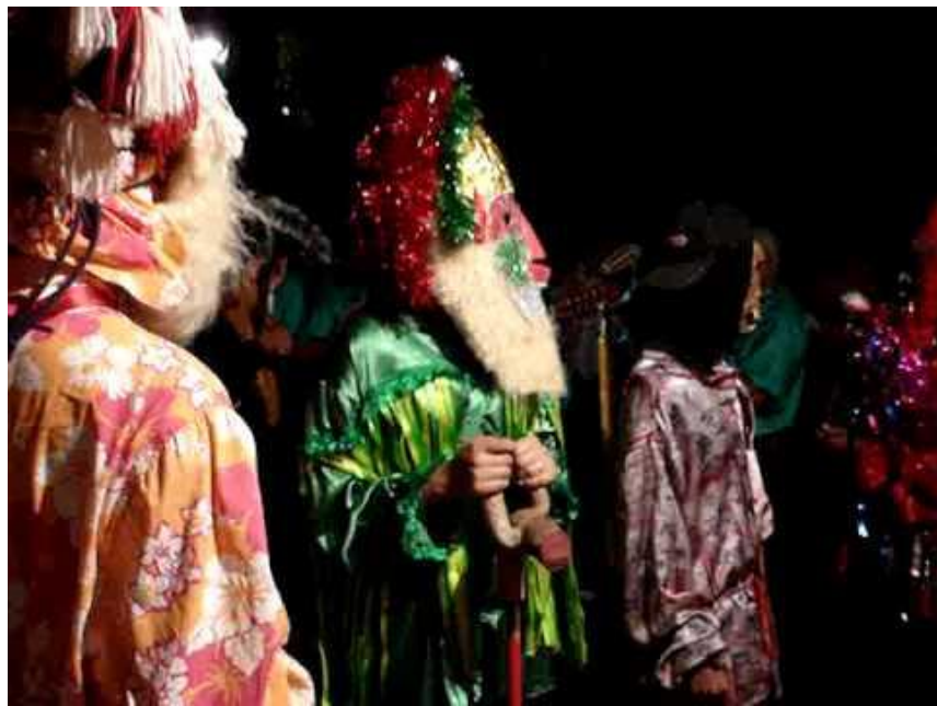
Companhia de Reis Coutinhos – Santo Antônio da Alegria - SP. 2010.