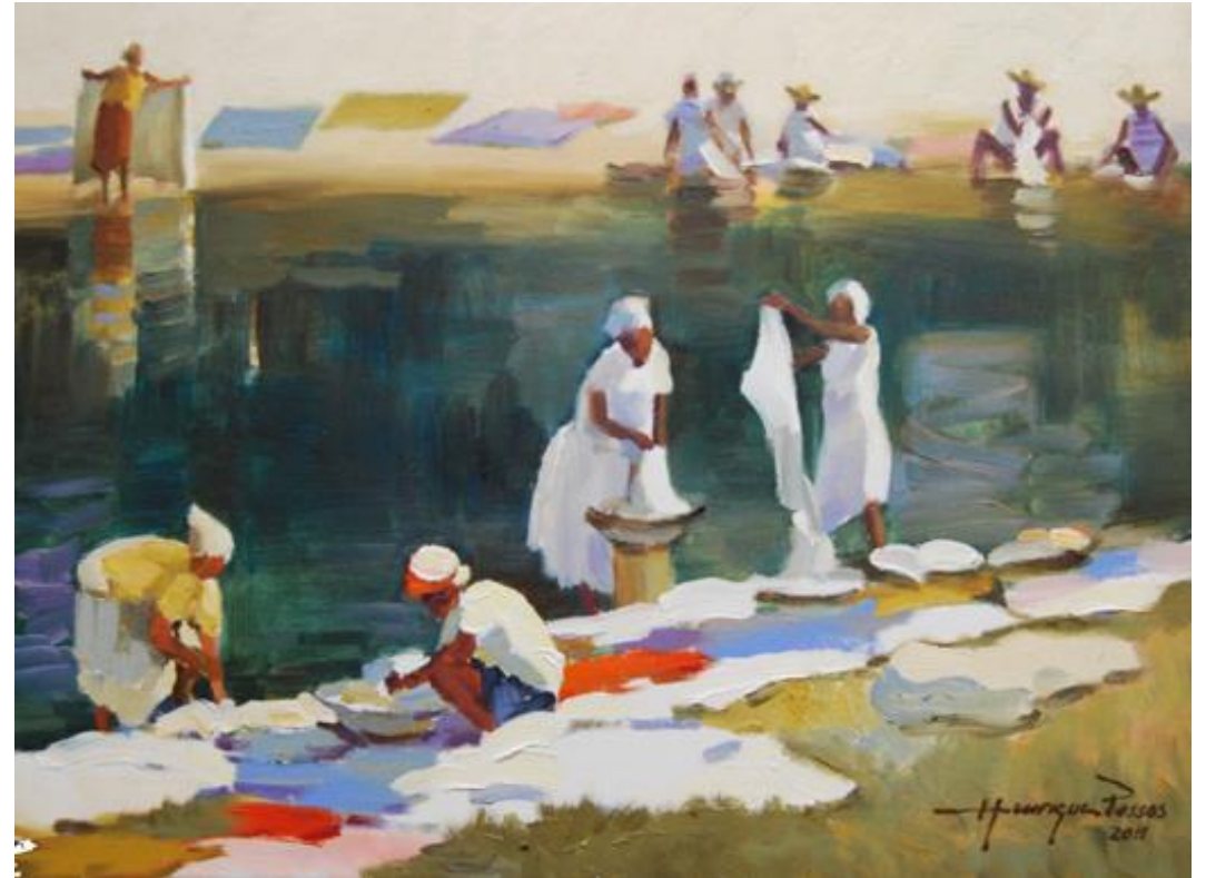
Abaeté – Lavadeiras. Henrique Passos – 2011.

https://www.youtube.com/watch?v=HTJo26KFHVI