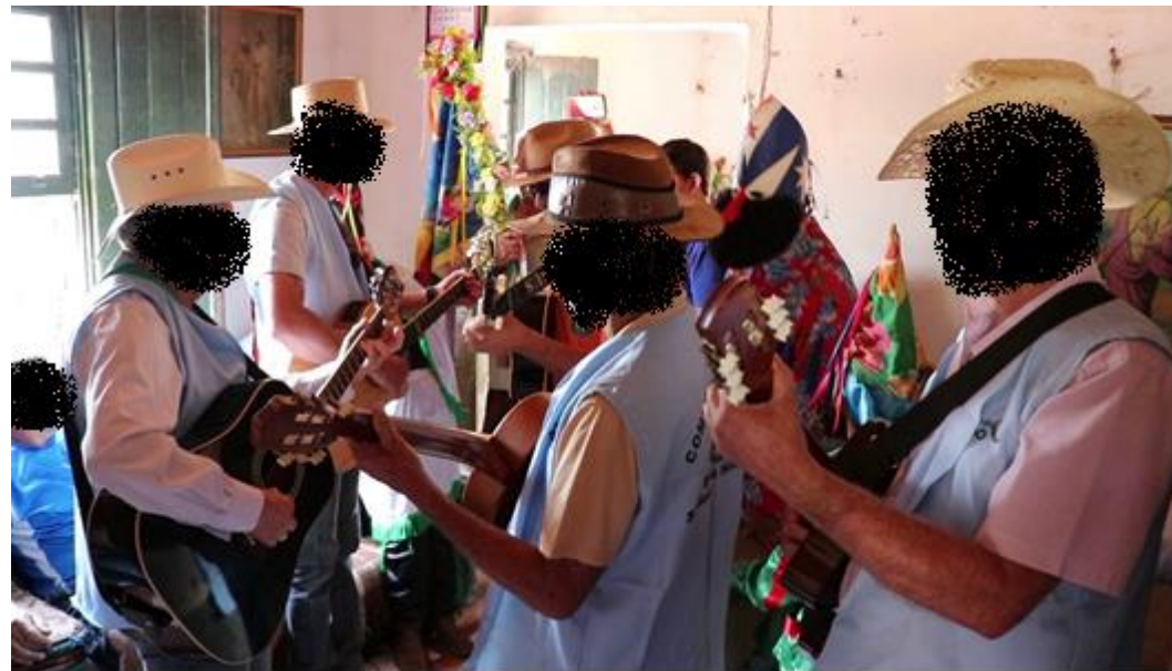
Companhia de Reis do Baú – Santo Antônio da Alegria - SP. 2019.