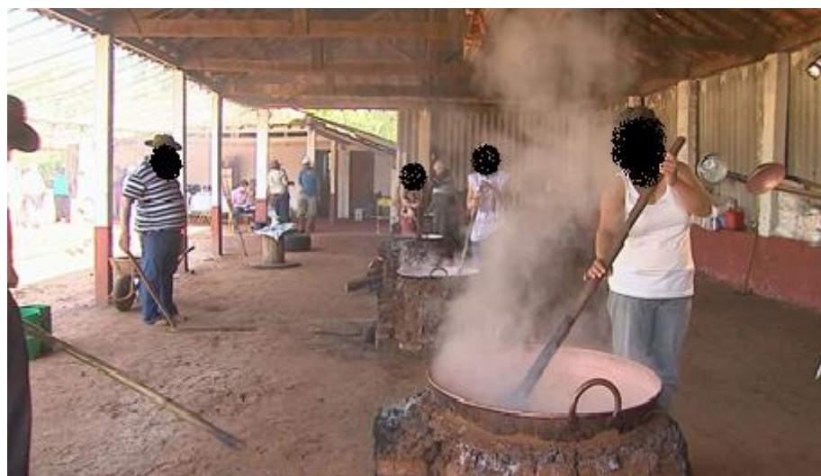
Preparativos para a Festa de Santos Reis no bairro Coutinhos – SAA. A manifestação também é um importante elemento de coesão social.