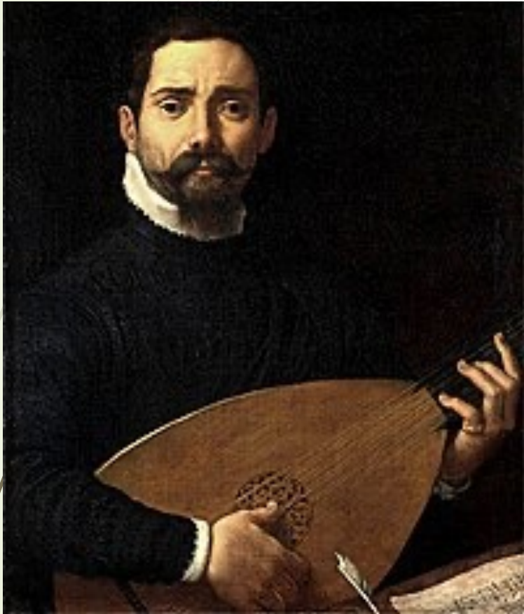
Giovanni Gabrieli (1557-1612)