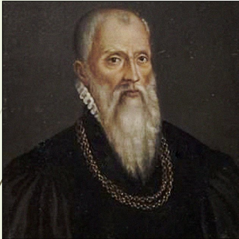
Adriano Willaert (1490-1562)