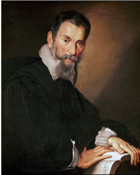
Cláudio Monteverdi (1567 – 1643)