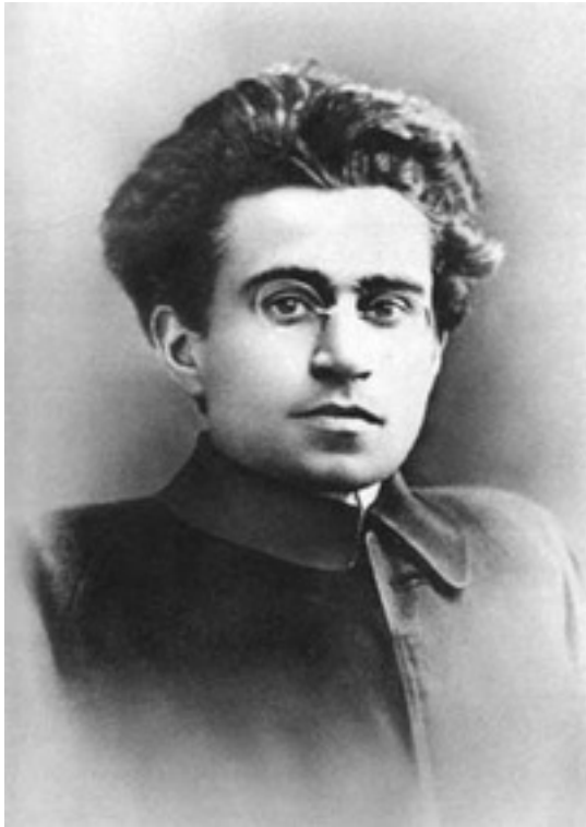
Antonio Sebastiano Francesco Gramsci